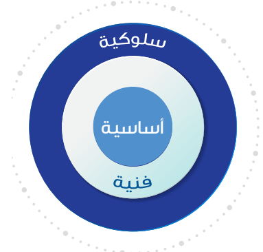
FA Competency Model